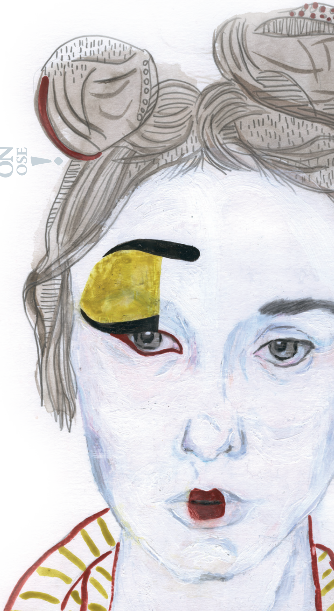
Illustration : Emma Haraké » » » »