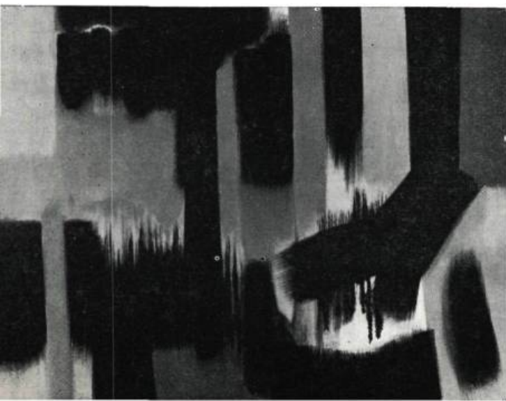
Indien Nord-Amérique , tableau en orangés, rouges, noirs et blanc, de Jean-Paul Mousseau. Exposé en mars à la galerie l'Actuelle, ce tableau a été demandé par la Galerie Nationale pour l'exposition de Peinture non-figurative du Canada, en tournée aux Etats-Unis sous les auspices du Smithsonian Institute; il fera partie de la collection permanente de la Galerie, à son retour, son acquisition ayant été annoncée récemment.