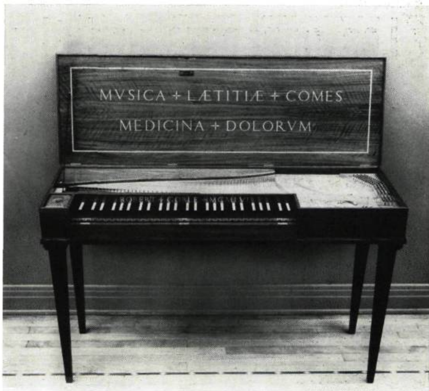
Ci-dessus: CLAVICORDE. — A NOTER : INSTRUMENT DE FACTURE ANGLAISE. GOBLE 1956.