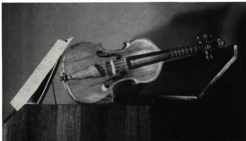
Ci-dessous: QUINTON. A NOTER, LES CINQ CORDES, LES TOUCHETTES.