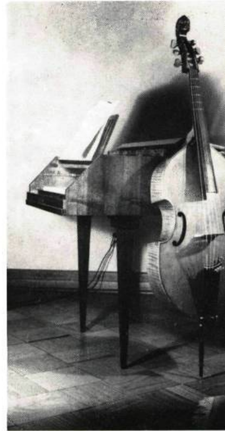
Ci-dessus : VIOLE DE GAMBE ET PETIT CLAVECIN.

Instruments à cordes: les violes, ancêtres de la famille des violons, ont six cordes peu tendues et donnent un son riche et intime. Un groupe travaille sur un quinton (Salomon, 1769); un dessus de viole (Sprenger, 1952); une viole d'amour (Hummel, 1709); une viole de gambe (Audinot, 1830). Sur disque i.a., BG - 539.; un luth, l'ancêtre de tous les instruments à cordes, ressemblant à la mandoline de forme. Sur disque i.a., BG - 539.