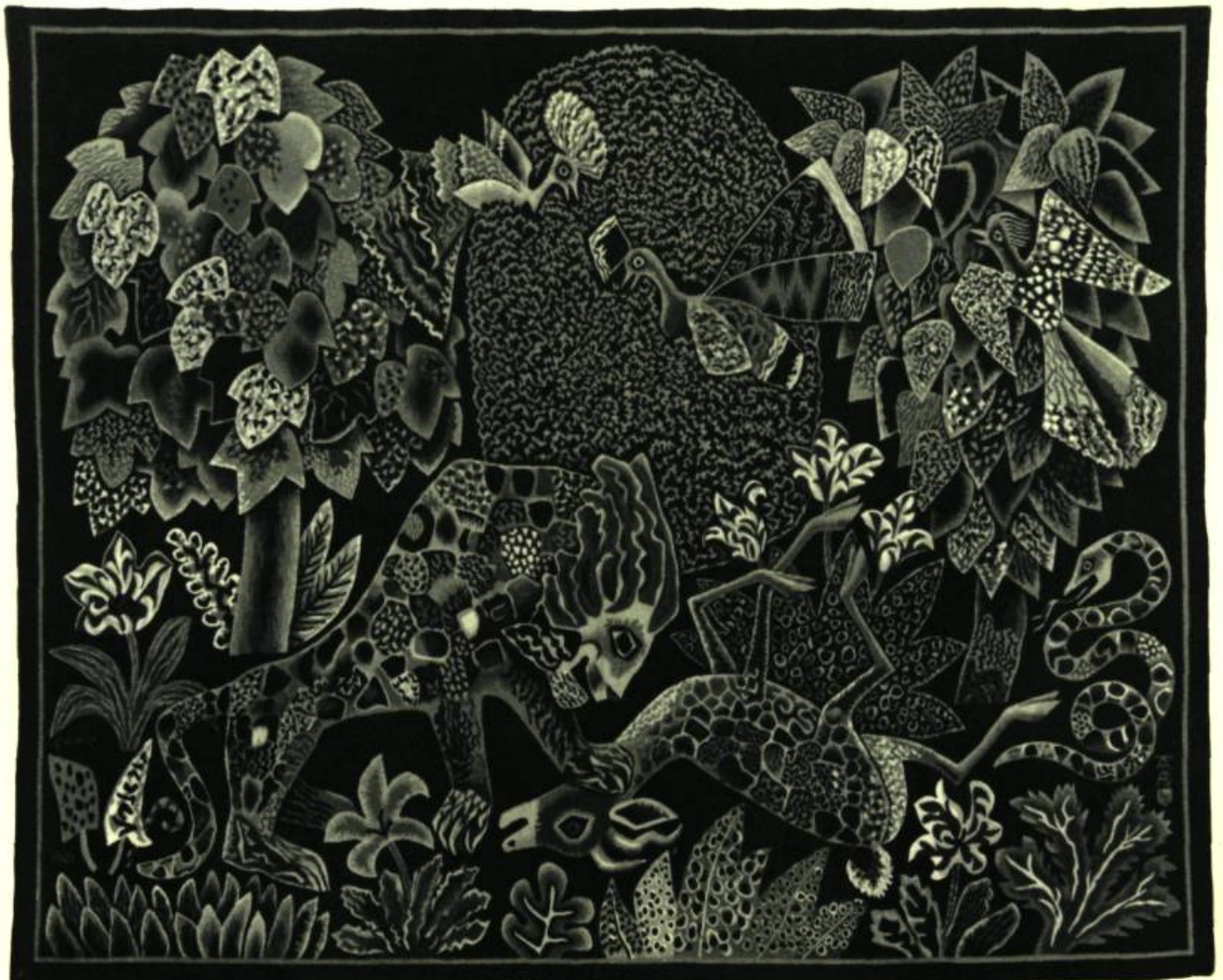
Dom Robert : LA JUNGLE. Tapisserie d'Aubusson. 6' 8½" x 5' 2¾". Montréal, Collection de Jean-Marie Gauvreau.