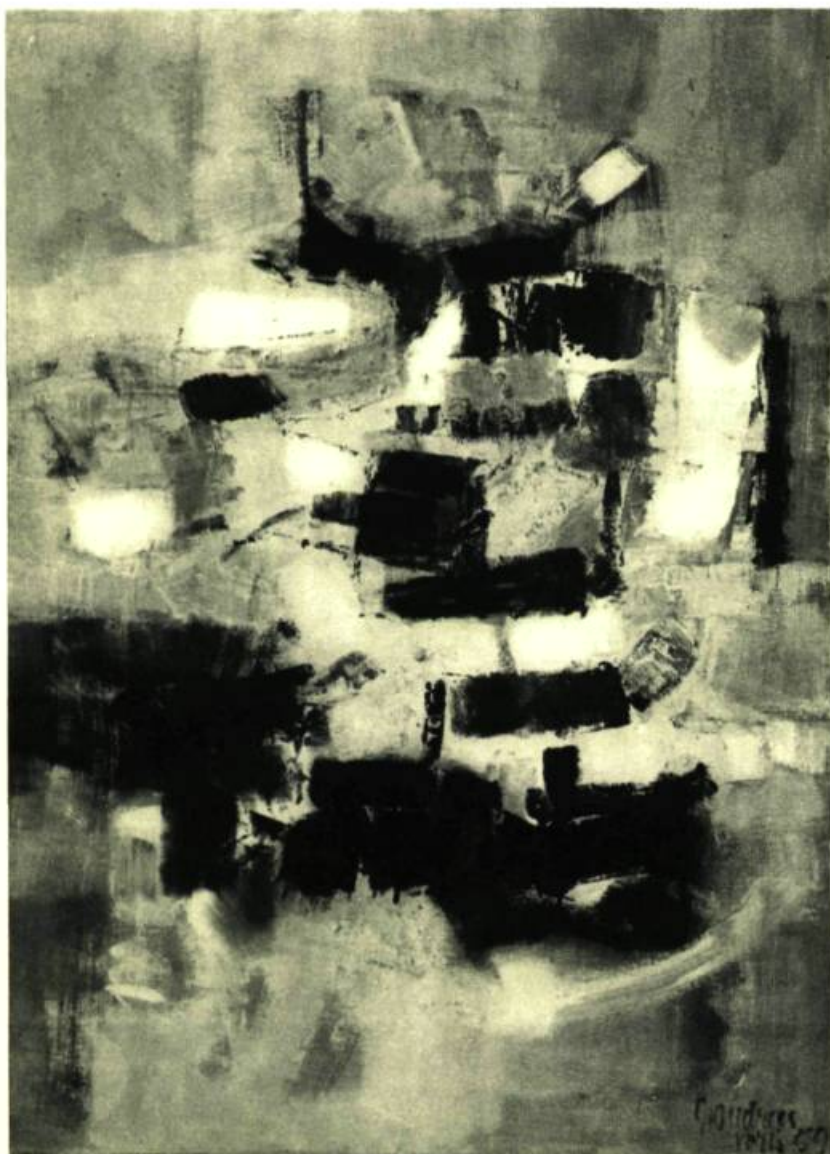
Une huile remarquée : Paysage oriental, de Pierre Gendron

Ces confusions sont préjudiciables dans une large mesure au milieu propre. L'on voit mal les discussions picturales d'une coterie de peintres qui est en même temps celle des autres arts plastiques, et en même temps celle des artisans, s'acheminer vers de fructueuses découvertes, ou simplement procéder de recherches sur la peinture pure. Les langages, les jergons des peintres sont trop différents de ceux des artisans, voire des sculpteurs. En définitive, aucun vocabulaire particulier, aucun es-