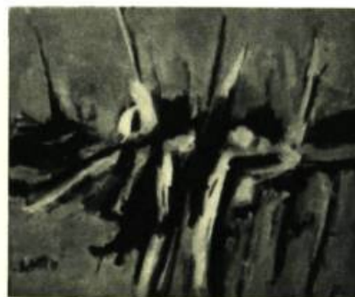
Les Noirs se cherchent. Huile de Denis Matte

Ce qui est plus, et autre handicap à mon sens, le milieu pictural du Québec se confond avec le milieu artistique-bohème montréalais (saut rares exceptions) et tout tourne en rond. Ce sont les mêmes qui peignent, qui se préoccupent d'art, et qui vivent en marge de la société bourgeoise. C'est peut-être cela qui nous permettra de comprendre la floraison de tableaux-contre à laquelle on assiste, cet isolement des rapins, ils ont mangé des raisins verts, et leurs dents en sont agacées. On les a mis tellement au ban de la société, qu'il leur est impossible de peindre pour. Ils peignent contre. Ils déterrent les rossignols, et crochètent les portes. Ils savent bien qu'ils ne plairont pas, cela les fouette plutôt, ils continuent. Il y a là de la fierté, de l'entêtement, et l'éternelle révolte des jeunes contre un