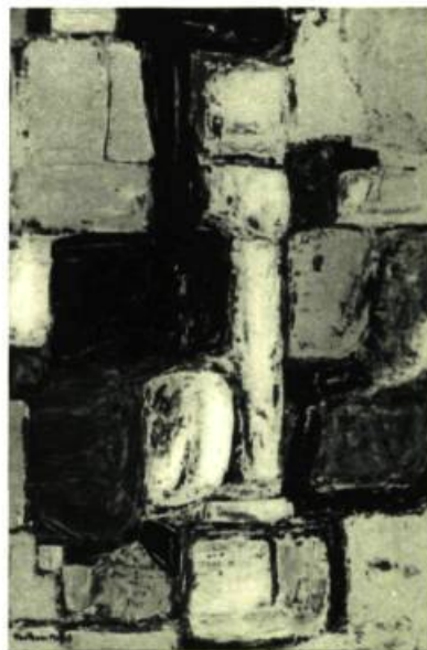
Génération. Gouache de Henriette Fauteux-Massé

également, d'un trait particulièrement heureux de canadianisme, si l'on veut bien admettre que le Québec, à tout le moins, est plus lyrique, plus frémis-sant, plus grouillant que le reste du continent. Ses impulsions profondes, qui sont amoindries par son voisinage, ressortent en peinture avec une grande force.