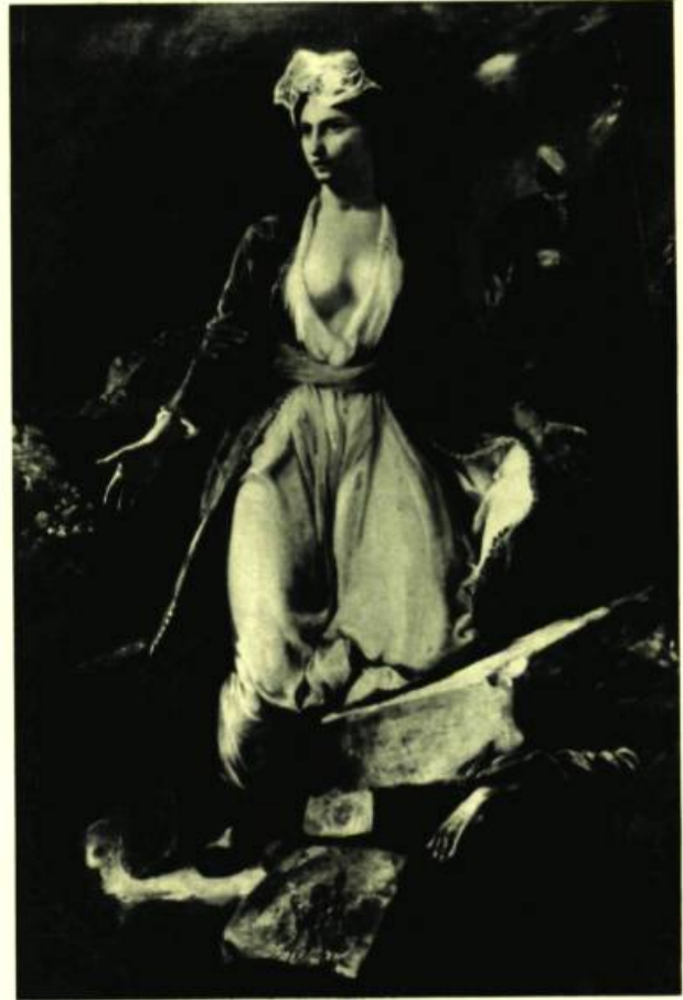
Eugène DELACROIX. (Charenton 1798 - Paris 1863). La Grèce expirante sur les ruines de Missolonghi.

Après avoir été un village de pêcheurs, cette bourgade que les Romains développèrent et dont les ruines du Palais Gallien où quelques stèles archéologiques attestent le passage, est devenue ce qu'ont voulu les hommes, c'est-à-dire un carrefour de voies maritimes et terrestres : chaque siècle a trouvé le sien, qu'il soit