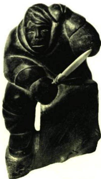
En haut à droite : Mère bibou et ses petits. ESQUIMAU. Saponite. Baie d'Hudson. Musée national du Canada. Au-dessous : Chasseur de phoques. ESQUIMAU. Baie d'Hudson. Musée national du Canada. Bas de la page à gauche : Mère et son enfant. ESQUIMAU. Kogalik, sculpteur. Saponite. Povungnetuck, Baie d'Hudson. Musée des Beaux-Arts de Montréal. A droite : Chasseur. ESQUIMAU, Levi sculpteur. Saponite et ivoire. Povungnetuck, Baie d'Hudson. Musée des Beaux-Arts de Montréal.