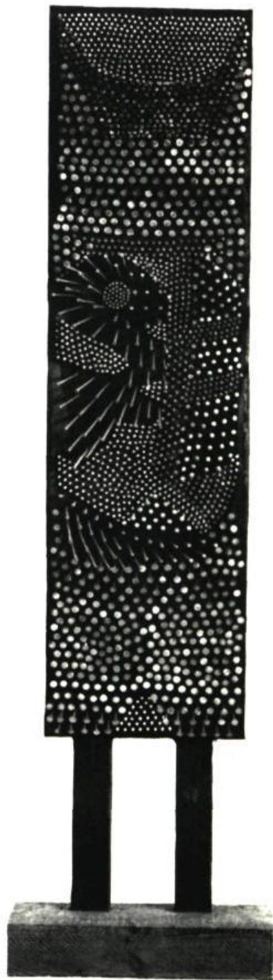
Ci-contre : Guido MOLINARI. Opposition Rectangulaire . Huile, 1962. David PARTRIDGE. Standing configuration no 9 . Bois et clous. Hauteur : 56" (142,65 cm). Acquisition du Musée des Beaux-Arts de Montréal.

Il y a eu plus de 1500 envois, dont on a retenu moins de 100 oeuvres. Et parmi cette élimination draconienne, on a établi une liste des gagnants. En tête d'affiche, « Opposition rectangulaire »,