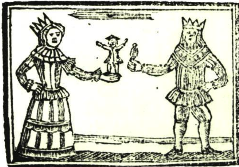
Gravure sur bois tirée de la page titre du livre «The Pleasant History of Jack Horner» Edition Drewry, Londres.

La Collection est consultée par des artistes, des collectionneurs, des écrivains, des éditeurs, des imprimeurs, des professeurs, des conservateurs de musée et de bibliothèque, et par tous ceux qui en général s'intéressent à la découverte de ces rares témoins qui ont traversé non seulement l'épreuve de la pouponnière, de la jardinière, mais celle encore plus redoutable du temps avant de finalement trouver un asile permanent au Canada.