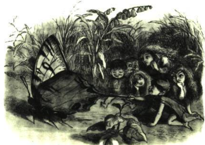
Princess Nobody — Andrew Lang. Illustration de Richard Doyle, 1884. Page ci-contre: Feuille d'épellation, environ 1800.

FRONTISPIECE CHOICE SCRAPS, Historical and Biographical, CONSISTING OF PLEASING STORIES AND DIVERTING ANECDOTES, Most of them short to prevent their being tiresome. Comprehending much useful Information and innocent Amusement. FOR YOUNG MINDS. Embellished with COPPER-PLATE CUTS, LONDON: Printed for E. NEWBERY, at the Corner of St. Paul's Church-Yard. [Price One Shilling.]