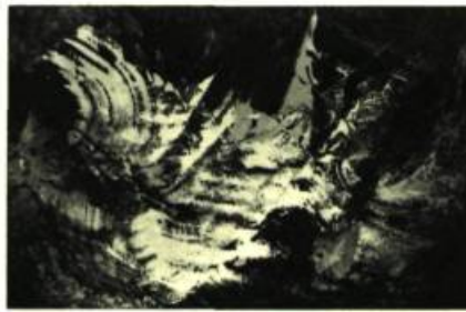
Léon Bellefleur Les hémisphères, 1964 huile sur toile, 51½" x 78"— Galerie du Siècle

celle de "Le progrès de la cruauté", où l'on se prend à penser à un rituel de Sade, celle des "Jardins suspendus de Babylone", où les rythmes des figures géométriques simples dressent dans l'espace étonné la chorégraphie de leurs jeux. Les belles compositions de "The Blue Boy", "Le sourire de la Joconde"; les jongleries subtiles de "Portrait de personnes inconnues no 2"; la mire centrale de "Le dauphin et sa famille", avec ses deux mouvements qui me rappelaient certaines articulations spatiales de la musique de Stockhausen. — Bon travail de Sullivan.