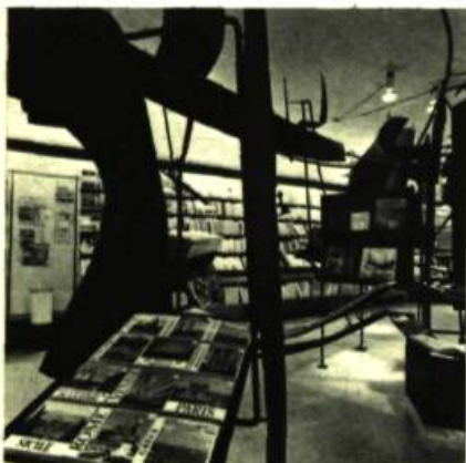
Une librairie et une maison d'éditions

Quand la librairie décide de faire peu neuve et d'utiliser toutes les ressources de l'art contemporain, sous forme d'architecture, de sculpture, d'éclairage et d'ordonnance des rayonnages, il en résulte, si c'est fait avec bon goût, une fête pour l'œil. Peu de passants, même les moins lèche-vitrines, ne sauraient rester indifférents à l'inspection de la nouvelle librairie A LA PAGE.