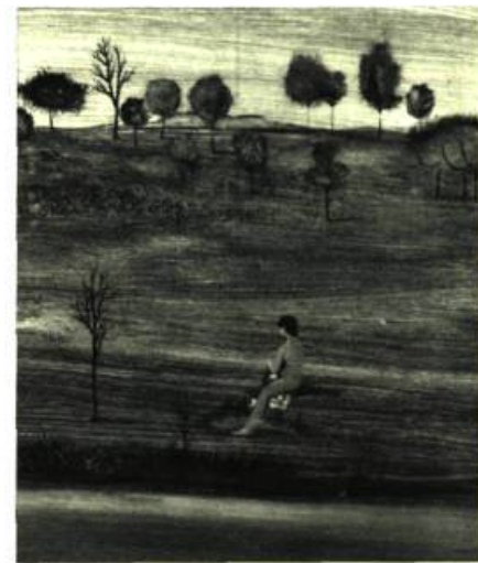
Gerard Clarkes — le Bain — huile 20 x 24" — Collection Dr. Dagenais-Pérusse.

Il se dégage de cette peinture une sensation de fraîcheur qui n'est pourtant pas obtenue par des effets de fausse naïveté (comme on le voit trop souvent) mais qui est véritable sympathie, véritable amour des prés et des espaces, du vent, du soleil. Un peintre qui semble sans complexes. Il faudra surveiller cela, ce n'est pas possible.