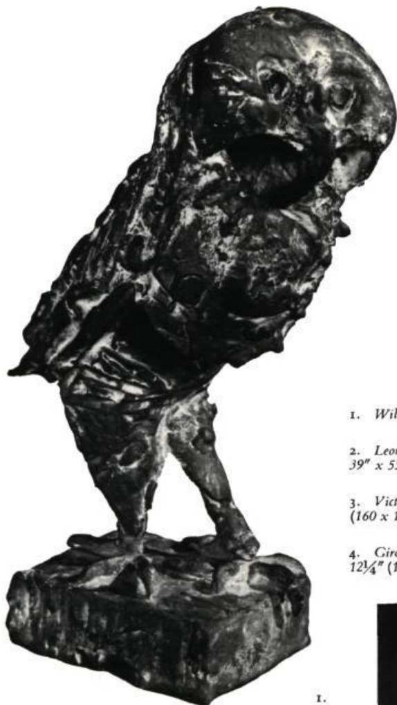
1. William Calfee: Hibou, Bronze.