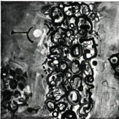
Edmund Alleyn. Jardin pour Anne . 1963. Huile . 39" x 39". Galerie Soixante .

Le Fébure, avec ses teintes plus sombres, ses sujets plus calmes, est luxueux. Il y a du raffinement dans ses juxtapositions de couleurs. On se dit, ce peintre adore peindre. Cela peut sembler évident. Non pas, chez tous. Pas de cet amour profond, vital. Et doux.