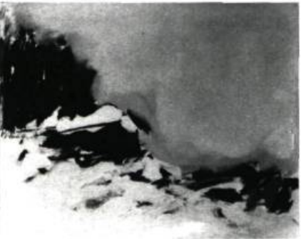
Billmeier. Hunting Lodge . 20" x 24". Art Français , Montréal.

Enfin, avec Football , Night Skating , nous sommes face au monde du sport. Un peu burlesque, soit, certainement caricatural mais tout à fait présent.