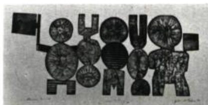
John Esler. America, America . Gravure. 18" x 31". Galerie 1640, Montréal.

Sa seconde et plus récente tendance est humanitaire. L'artiste la présente de façon figurative; dans certains dessins, elle restait irrésolue alors que dans d'autres elle était ou paraissait sans valeur — mais elle était présente avec insistance dans tous.