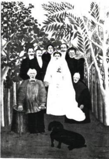
Le douanier Rousseau. La noce. Exposition Paul Guillaume—Jean Walter, Orangerie des Tuileries, Paris.

Ce que l'on aime à peu près généralement? Ce sont les Cézanne parmi lesquels on retrouve Portrait de Madame Cézanne et Madame Cézanne au jardin mais parmi lesquels on découvre aussi tel petit paysage lumineux, ou telle nature morte admirable. Ce sont six Picasso roses magnifiques, et neuf douanier Rousseau avec notamment les deux illustres toiles que sont La Noce et La Carriole du Père Juniet . Ce sont enfin les Soutine, sans doute l'apport principal de Guillaume, le collectionneur-phare, où les formes tourmentées et l'humour macabre se mêlent avec une puissance rare. Et puis dans un coin, trois paysages superbes: un Sisley, un Monet, un Gauguin: trois peintres, trois chefs-d'œuvre côte à côte. On compare, on hésite... et alors, un peu plus loin on aperçoit un paysage bleu de Renoir qui est d'une richesse, d'une profondeur, d'une beauté irrésistibles. C'est comme la clef de l'exposition.