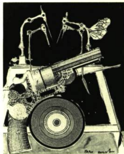
Max Ernst. Dessin. Collection particulière

L'Exposition du Musée d'Art Moderne est un témoignage irrécusable.