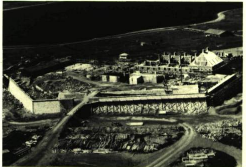
Ci-dessus, haut: vue du Château Saint-Louis, vers 1733. Bibliothèque de l' Arsenal, Paris; milieu: vue nord-ouest des ruines de Louisbourg par Thomas Wright, en 1766; bas: vue aérienne récente des chantiers de construction du Bastion Royal et du Château Saint-Louis.