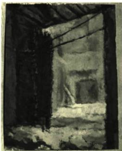
Claude Fleury. Composition. Gouache. Galerie Zanettin, Québec.

La sobriété est la règle première de son art, teinté d'un dépouillement et d'une sensualité volontaire qui sont d'une expression de discrétion. Tout son art est simplification; il réduit tout à l'essence pour mieux construire et mieux pétrir cette terre. Il se construit lentement un style particulier de formes qui lui serviront à traduire ses pensées et ses émotions esthétiques. Une véritable éthique émerge de son esthétique. Gilles Dionne cherche nettement à se libérer des sentiers battus et apporte un souffle nouveau à l'art de la céramique.