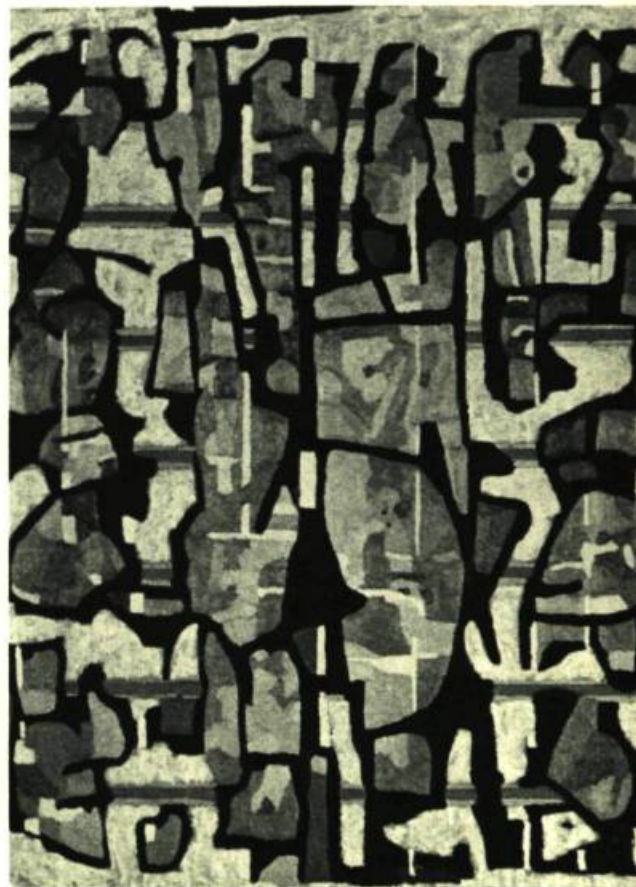
Ci-dessus : FRANCISCO ICAZA. Hommage au baroque maya. 1967. Huile sur toile.

actuels de communication et des nouvelles formes de pensée et de création. Ces éléments, ajoutés à la tradition, ont accru la vitalité des divers mouvements artistiques au Mexique, de sorte que l'art mexicain d'aujourd'hui, tout en assumant la tradition, ne peut se soustraire à la société dans laquelle il évolue présentement. La tension entre ces deux pôles constitue un des éléments de son authenticité; ce trait caractéristique de l'art mexicain est apparu à toutes les époques de l'histoire des arts en ce pays.