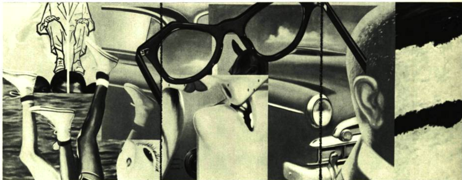
Painting for the American Negro, 1962-63. Huile sur toile. 80'' x 210'' (203,2 x 533,4 cm)

La publicité et le panneau-réclame n'ont pas donné la toile de grand format. Pour les peintres américains c'est, entre autres sources parce qu'il y en a plus d'une,