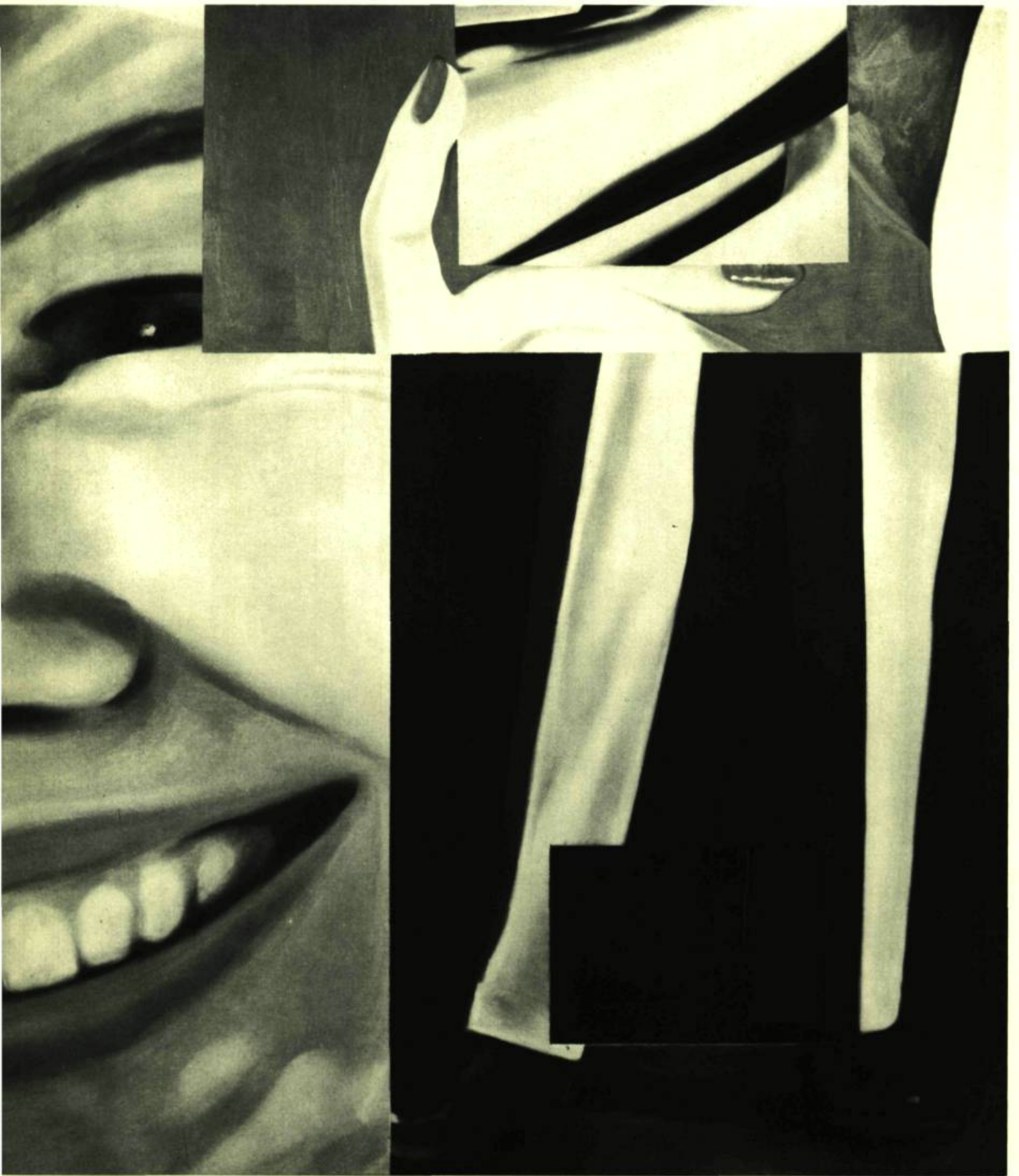
James ROSENQUIST. Look Alive . 1961. Huile sur toile avec miroir. 67'' x 58½'' (170,2 x 148,6 cm). Collection Famille Harry N. Abrams, New York.