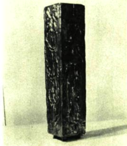
Vase de Bernard Chaudron.