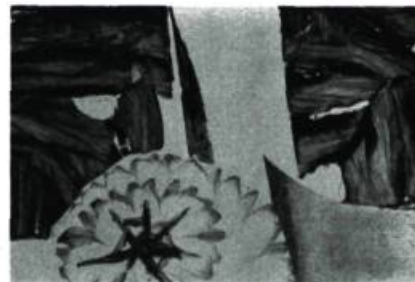
Jean Le Tarte. Encre de couleurs. Galerie le Gobelet, Montréal.

thématique n'en n'est pas moins intéressant car il nous révèle, par les divers sujets abordés, tout l'aspect anthropologique qui s'incarne dans cet art. L'esquimau qui brandit son harpon ou la mère qui porte son enfant sur son dos sont peut-être des œuvres schématiques; leurs expressions n'en restent pas moins très dégagées grâce à un travail minutieux. Le sculpteur esquimau a su dégager des schèmes habituels de son œuvre une expressivité qui traduit avec densité des sentiments très personnels.