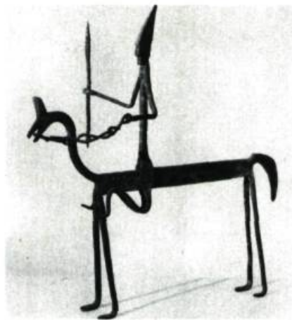
Bambara. Chevalier représentant un ancêtre. Fer forgé. Galerie Lippel.

Si on s'en remet à la technique utilisée, on perçoit toute une schématisation provenant du traitement employé. Mais dans cette simplicité apparente l'harmonie et la douceur des lignes vont de pair avec un procédé plastique très élaboré. L'aspect