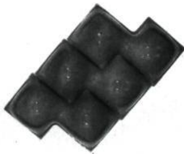
Jean Noël. Ovexpansible rouge . Plexiglass soufflé. 48" x 72" x 12" (121,95 x 182,9 x 30,5 cm). Carmen Lamanna Gallery, Toronto .

Nous pouvions admirer également des papiers collés dont chaque bordure parallèle se terminait par des rayures de diverses couleurs, mettant ainsi en évidence la surface plane du centre. Cette exposition nous donnait l'exemple d'un artiste prolifique et original, dont le succès semble déjà assuré.