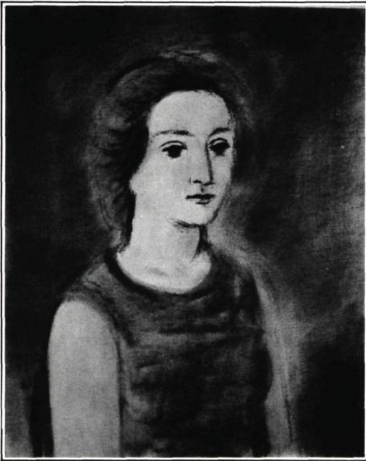
Portrait de femme.

certaines toiles laissent paraître une certaine "vigueur" et une "santé étale".