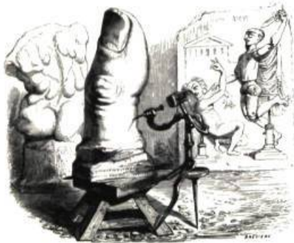
Une étonnante anticipation du Pouce de César .