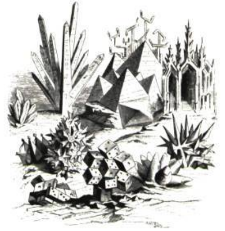
Cristallisations de l'architecture.