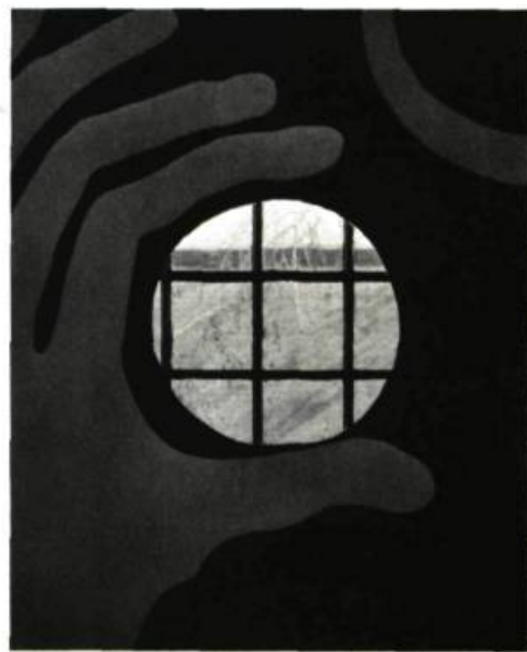
Sylvie Melançon VERS L'IMPORTANT EN PASSANT PAR LES CHOSSES, 1970. Galerie de l'Étable. Musée des Beaux-Arts de Montréal. Toile; Acrylique et acétate transparente; 4 pi. sur 5 (121,95 x 152,45 cm)

Une première grande exposition. Une définition d'un monde jeune, vu avec des yeux pleins d'enthousiasme. Beaucoup d'appétit aussi. Trois tendances: la première, évocatrice de personnages en situation, très humains, des couleurs douces, gris et bleu, celles de la tendresse. Puis, une seconde manière, sorte de poétique de la nuit avec des fonds bleu intense et un graphisme robuste dans des tons d'orange et de blanc. La troisième manière répond mieux au désir de la découverte. Elle marque la volonté d'ouvrir le tableau, de faire entrer de la lumière, de s'assurer la participation d'un fond de décor. Il plane dans ces grands tableaux un souffle frais, gai; du pop, hanté par le goût du théâtral. De l'élan, une progression vers la maturité.