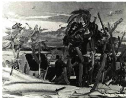
Tremblé. L'ARBRE. Huile.