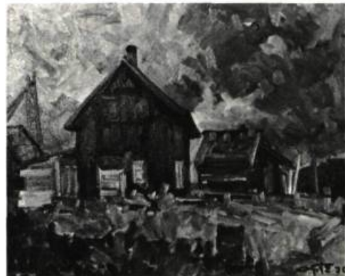
Léo Ayotte. PRÈS DE SAINTE-ROSE. Huile.

Par contre, il éprouve un immense besoin de se dégager de la réalité pour entrer dans un certain absolu. Alternent entre la ferveur, source de lyrisme, et une certaine froideur analytique qui relie par des schémas intérieurs. Donc, deux tendances et une oeuvre à deux saisons, le printemps et l'automne. Un certain refus de l'hiver. Une oeuvre qui refète le chercheur sincère épris de solutions sans être jamais complètement satisfait d'une trouvaille. Ici, la peinture est affaire de discrétion, de qualité.