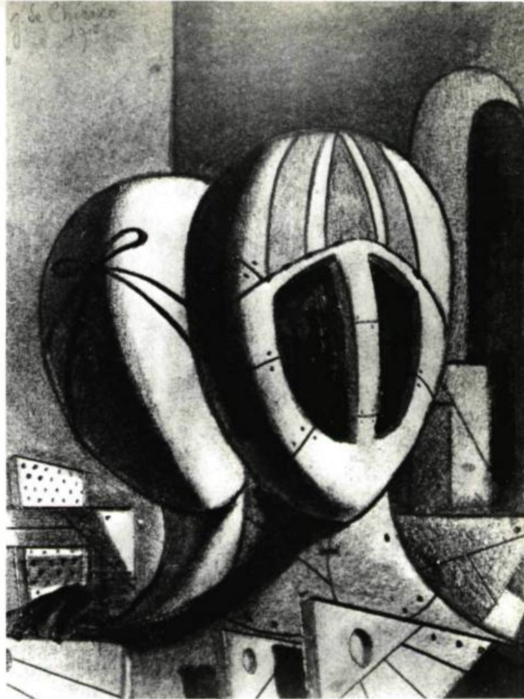
giorgio de chirico (1888 - ) deux têtes de mannequin. crayon; 8 po. \frac{9}{16} sur 6 \frac{3}{4} (21,6 x 17,15 cm.).

mains. Ainsi, peu à peu, au hasard d'événements et de rencontres qui les ont favorisés, mais qu'ils ont aussi recherchés, et à force d'accumuler sans cesse des chefs-d'œuvre, la collection de tableaux devait prendre des proportions imposantes, en même temps que s'affirmaient les goûts et tendances de nos collectionneurs.