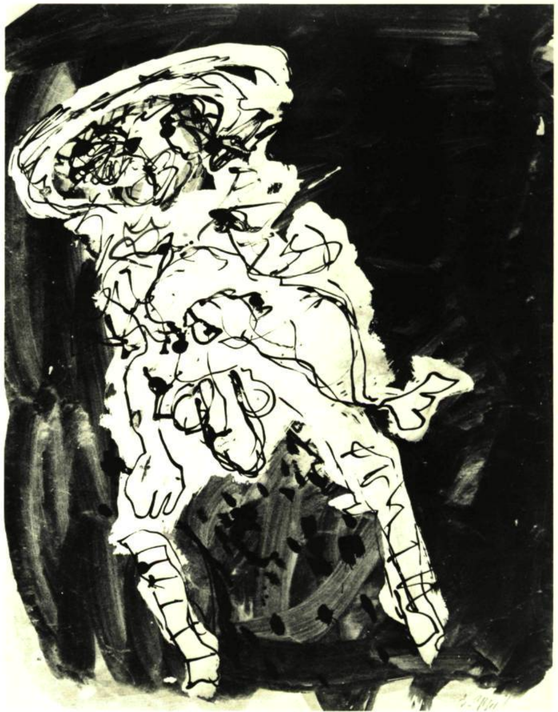
karel appel (1921 - ) man in the wind , 1953. gouache; 24 po. 15/16 sur 18 \frac{7}{8} (63 x 47,95 cm.). toronto, art gallery of ontario. (don de sam et ayala zacks, 1970.)