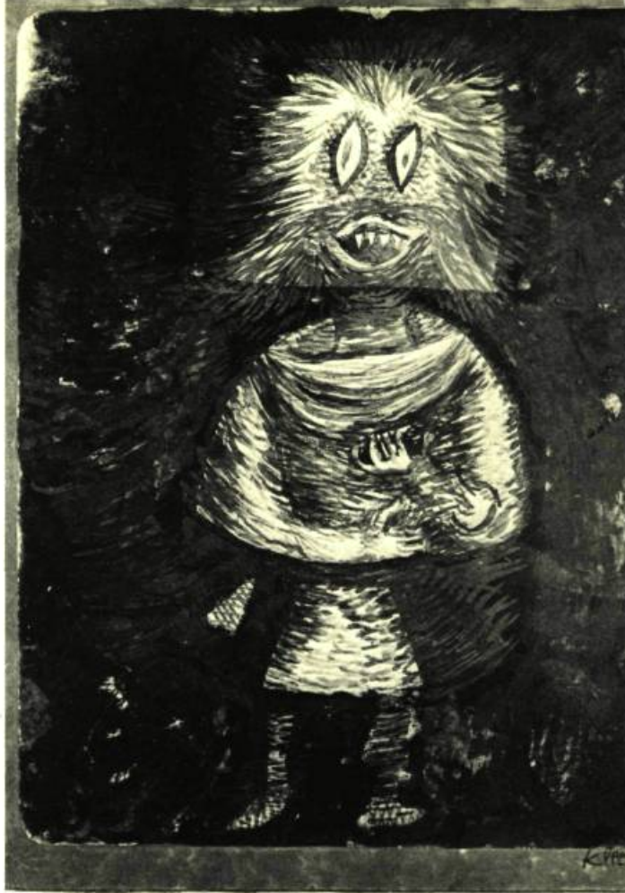
paul klee (1879 - 1940) the dangerous fool , 1923. aquarelle; 9 po. \frac{3}{4} sur 7\frac{3}{8} (24,7 x 18,7 cm.).