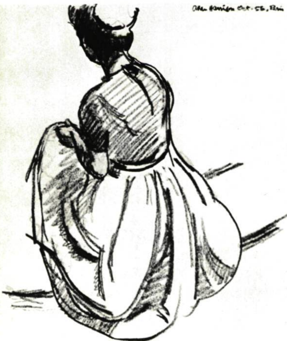
1. Intérieur, rue Crescent, 1970. Huile sur toile.

Il revient à Montréal en 1959, enseigne l'art graphique à la Sir George Williams University de 1961 à 1965, puis le dessin et l'art graphique à l'Université du Québec, de 1969 à 1971. Il a également donné des cours à l'École d'Architecture de l'Université