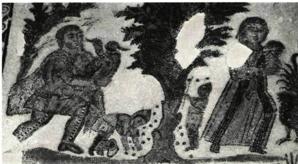
4. L'hiver: deux paysans gaulant des olives . Détail de l'illustration 1..

Debout, devant un fauteuil placé au pied d'un rosier, la femme du maître se tient les jambes croisées, le coude appuyé sur une colonnette. Vêtue d'une longue robe brodée et transparente, elle achève de se parer de ses bijoux. Une servante lui tend