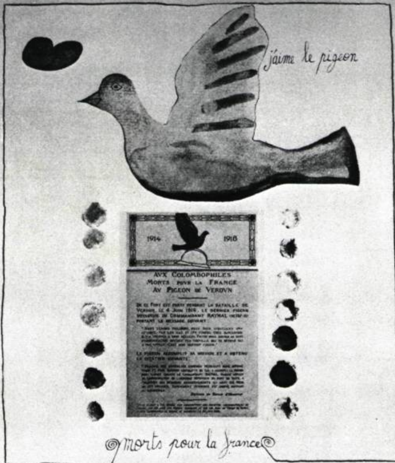
6. J'aime le pigeon , 1973. Lithographie; 25 po. 1/2 x 19 3/4 (64,8 x 50,5 cm.). Réalisée avec l'aide du Conseil de Recherches de l'Université de Moncton.

© morts pour la France 4/25 Francis Coutellier 73