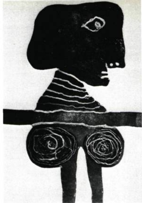
5. Personnage célèbre , 1973. Gravure sur bois; 26 po. x 20 (66 x 50,8 cm.).

Voilà tout un gestuel où transparait bien sûr la personnalité de l'artiste. Son œuvre n'est-elle pas quelque peu moraliste? Il ne faudrait pas oublier pour autant le travail de composition et d'agencement des couleurs. C'est de là que Coutellier tire son plaisir de créateur. Il est vrai que l'utilisation qu'il fait de la ligne et des couleurs peut nous conduire à ne nous attacher qu'à une lecture enfantine . A ce sujet la recherche picturale paraîtra parfois hésitante, le dessin un peu négligé, la composition surchargée là où l'idée ou l'intuition semble avoir pris le pas sur la recherche strictement plastique. Mais la passion de la ligne, tantôt dessinée, tantôt limite de deux surfaces colorées, lui fait aimer en général les contours précis, surtout dans les tapisseries où, respectant les exigences même du médium, l'artiste fait preuve de plus d'économie. Toujours la manière de Coutellier est en conformité avec sa façon d'aborder et la création et la réalité. Cela s'appelle la cohérence. Cela s'appelle pratiquer une esthétique qui soit en même temps une éthique.