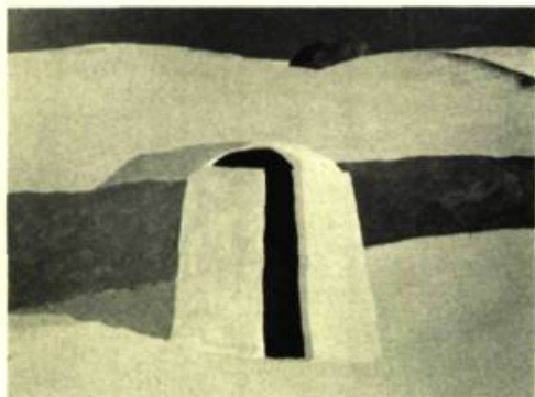
2. San Carlos Tower . Acrylique sur panneau de bois; 51 cm. x 65.