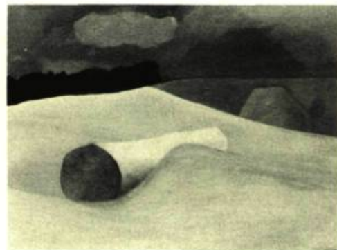
5. Stranded , 1972. Huile sur panneau de bois; 51 cm. x 65.