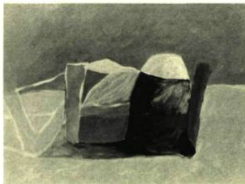
4. Still Life , 1968. Huile sur panneau de bois; 51 cm. x 65.