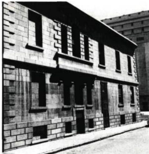
3. Côté sud montrant le déséquilibre causé par l'agrandissement du côté du port.

La gravure qui accompagne cette description, ainsi que le dessin aquarellé fait par John Ostell pour l' Album de Jacques Viger sont conformes aux plans exécutés, en 1870, pour le ministère fédéral des Travaux Publics. Si on les compare avec l'état actuel de l'édifice, on peut constater certaines modifications de structure importantes, outre quelques différen-