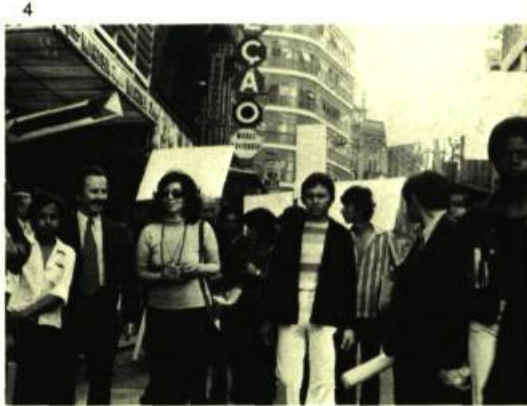
3. La Page blanche du Monde. Titre de l'œuvre: 150 cm 2 de papier journal.