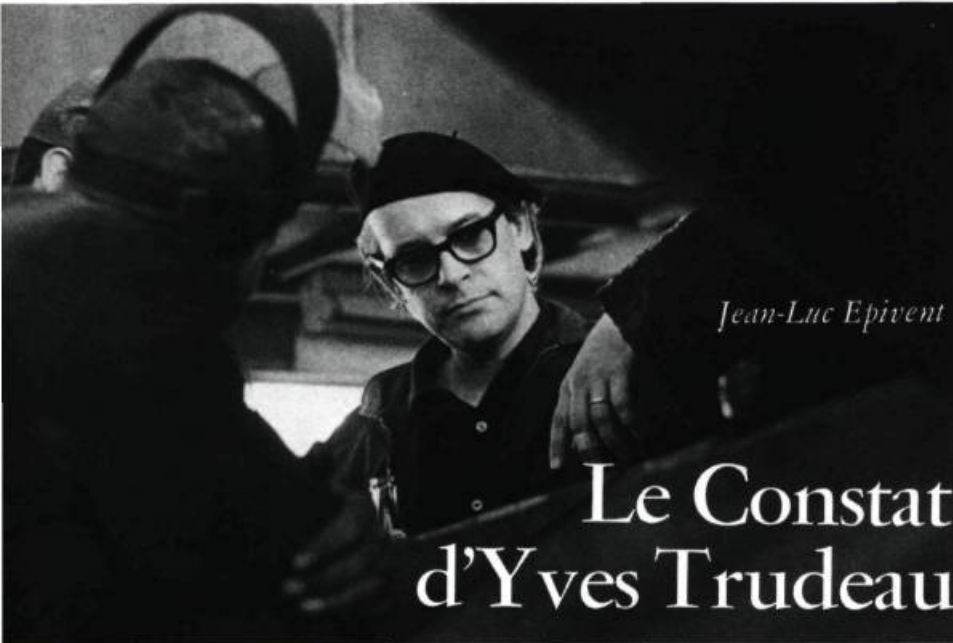
1. L'artiste discutant de problèmes techniques.

L'article de Jean-Luc Epivent a été écrit en France, à l'occasion d'une exposition des œuvres d'Yves Trudeau tenue au Centre Culturel Canadien de Paris avant d'être présentée à Bruxelles et à Londres. Au cours de l'été, le Musée d'Art Contemporain a organisé une exposition d'œuvres monumentales d'Yves Trudeau. Pendant ce temps, le sculpteur, sur invitation de la Commission de la Capitale Nationale, exécutait, en acier doux, dans le Parc Laurier, à Hull, une sculpture de plus de 4 mètres et demi.