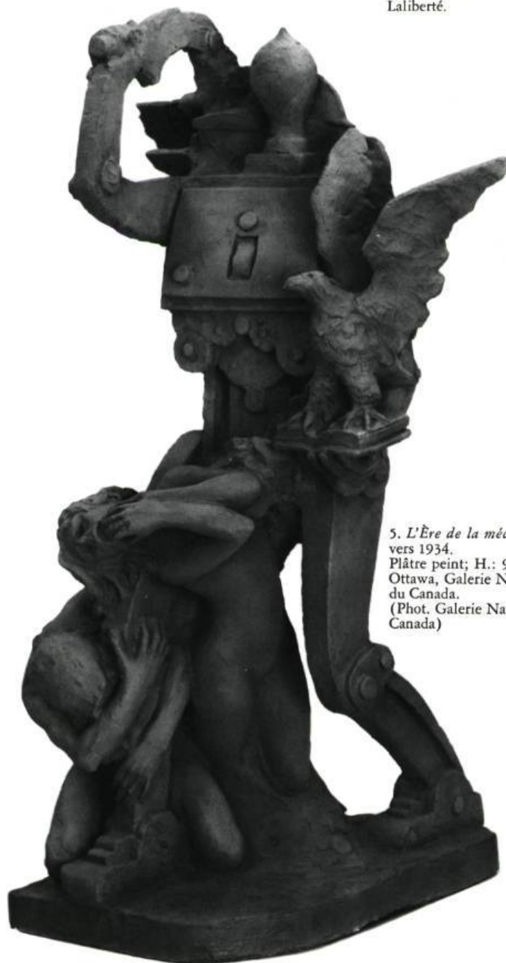
5. L'Ère de la mécanique, vers 1934. Plâtre peint; H.: 99 cm 06. Ottawa, Galerie Nationale du Canada.