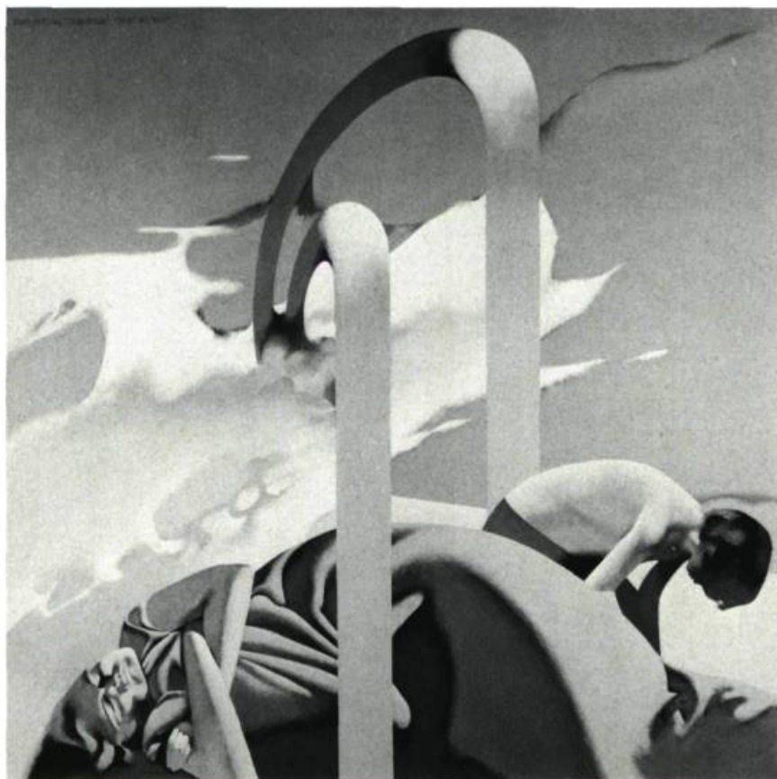
1. Jean-Jacques TREMBLAY White Cap , 1976. Acrylique sur toile; 91 cm 44 x 91,44.

Pourquoi Jean-Jacques Tremblay, né en 1926, n'aura-t-il connu sa première exposition individuelle qu'en 1976, à la Galerie Libre? C'est qu'en réalité, il ne se consacre vraiment à son œuvre de peintre que depuis le début des années 1970, après avoir été surtout illustrateur. Il vient donc à la peinture après un long détour, depuis l'École des Beaux-Arts, où il suivit les cours de Pellan et de Cosgrove, et l'École du Musée de la rue Sherbrooke, où il travailla la gravure.