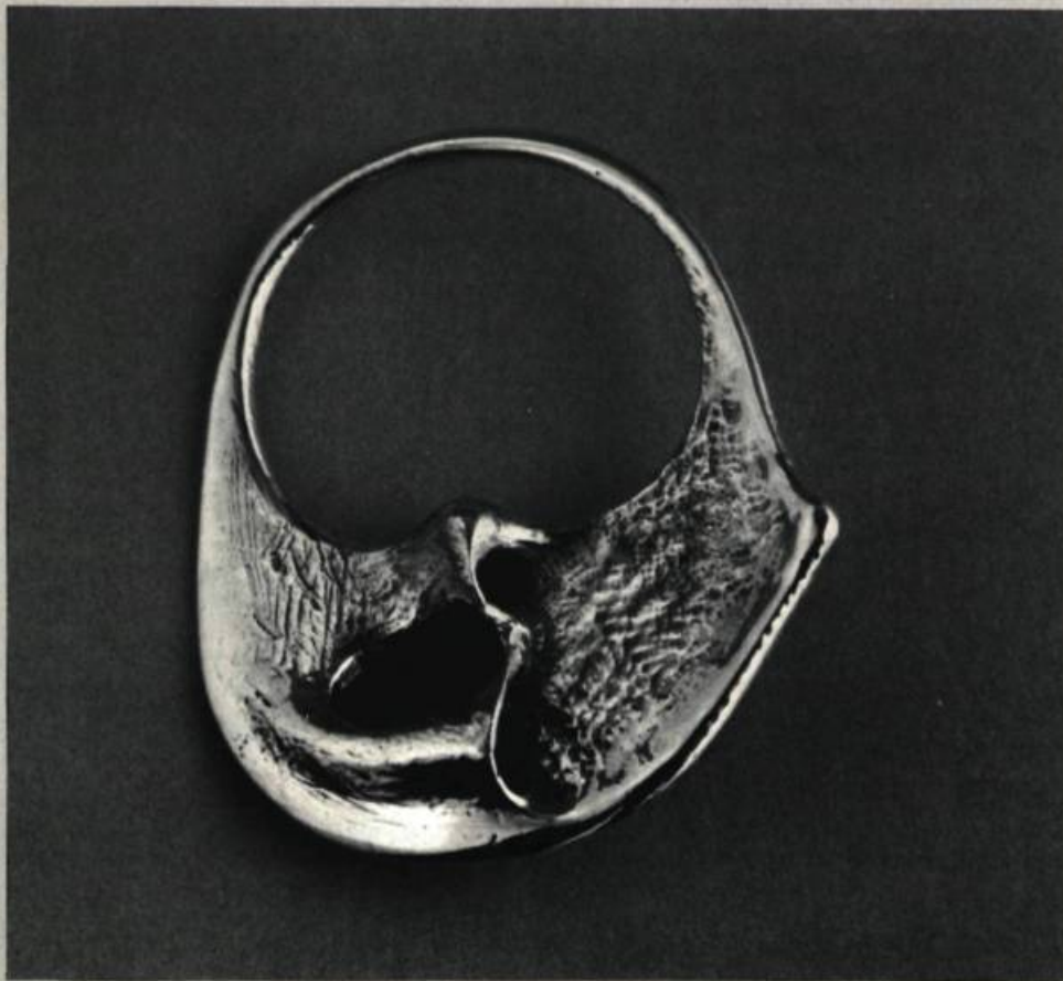
1. Jacques DIEUDONNÉ Sans titre.