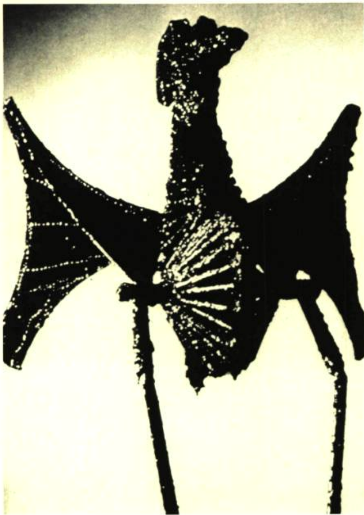
2. Clode PILOTTE L'Oiseau.

Cinq sculpteurs, cinq voies différentes par lesquelles ces artistes québécois nous invitent à découvrir les formes variées qu'ils animent et l'esprit secret et indomptable qui les a fait naître.