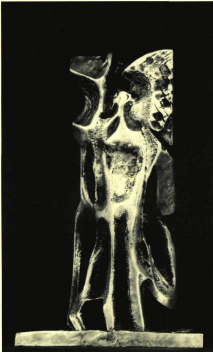
5. Pier GABRIEL Femme-matière.

s'apparentent beaucoup plus au bas-relief qu'elles ne procèdent à une exploitation systématique de l'espace. En 1978, l'artiste tenta de nouvelles expériences en incorporant aux métaux de la fibre de verre et des résines plastiques, dans le but de conférer à ses sculptures plus de légèreté et de luminosité. Cette expérience donna des résultats inespérés qui lui permettent de traduire, avec toute la subtilité possible, la sensibilité et l'authenticité qui sont au centre de son œuvre.