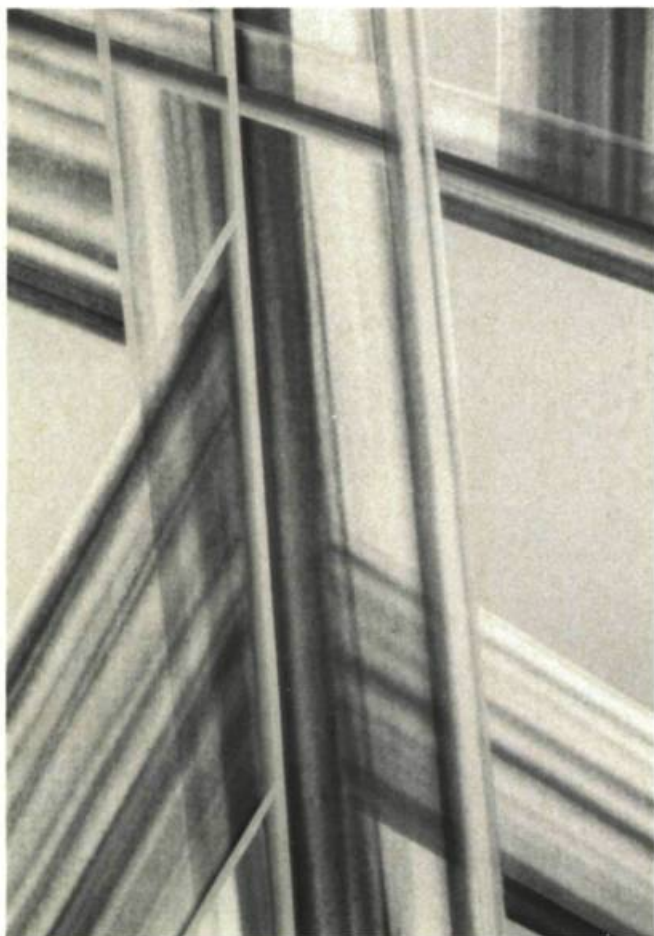
2. Tetric, ou Stèle à Stella , 1979.

3. Sans titre, 1979. Acrylique sur toile; 1 m 52 x 91 cm 44.