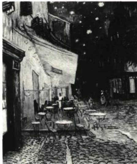
Vincent van GOGH

MUSÉE DES BEAUX-ARTS DE L'ONTARIO, Grange Park. Jusqu'au 4 janvier: Turner et le sublime, Aquarelles, dessins et gravures; Aquarelles et dessins historiques canadiens; Jusqu'au 29 mars: Travaux contemporains; Du 10 janvier au 8 mars: Photographies de la Collection Sam Wagstaff; Du 17 janvier au 1er mars: Le Hanovre de Carl Schaefer; Du 24 janvier au 22 mars: Vincent van Gogh et la naissance du Cloisonnisme; A partir du 7 mars: Illusions en transition; A partir du 14 mars: David Milne, Gravures, huiles et aquarelles.