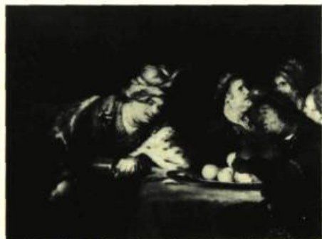
Aert de GELDER

THE DETROIT INSTITUTE OF ARTS, 5200, avenue Woodward. Du 12 janvier au 22 février: Jades provenant de collections de Hong Kong et des Etats-Unis; Du 1er février au 15 mars: David Smith, Dessins; A partir du 18 février: Dieux, saints et héros: Peinture hollandaise à l'époque de Rembrandt.