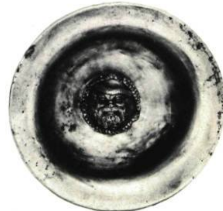
Kaiyx en argent. Grèce, Ministère de la Culture et des Sciences; Manolis Andronikos.

NATIONAL GALLERY OF ART, 6e Rue et Avenue de la Constitution Nord-Ouest. Jusqu'au 4 janvier: Dieux, saints et héros: La Peinture hollandaise à l'époque de Rembrandt; A partir du 25 janvier: Hans Baldung Grien, Gravures et dessins; Jusqu'au 15 mars: Picasso: Les Saltimbanques; Jusqu'au 15 avril: A la Recherche d'Alexandre le Grand, Objets.