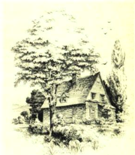
Le Masson abandonné

MUSÉE DU QUÉBEC, Parc des Champs de Bataille. Jusqu'au 25 janvier: A la découverte du patrimoine... avec Gérard Morisset; Jusqu'au 1er février: Giacomo Manzu; Jusqu'au 15 mars: Ethnologie inuit et amérindienne; Du 14 janvier au 1er mars: Fernand Leduc; Du 4 février au 1er mars: Nouvelles acquisitions; A partir du 11 mars: Art contemporain du Sénégal; A partir du 25 mars: Collection de céramique québécoise; En permanence: Peinture, sculpture, orfèvrerie et mobilier de l'époque victorienne.