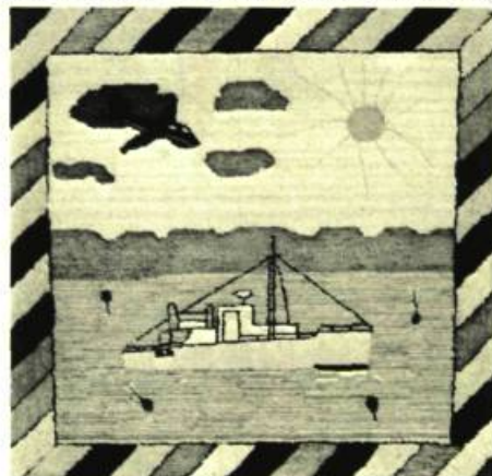
Tapis croché de Terre-Neuve et du Labrador

MAISON DU CANADA, Trafalgar Square. Jusqu'au 14 janvier: L'Étoffe de leur vie — Tapis crochétés et poinçonnés de Terre-Neuve et du Labrador.