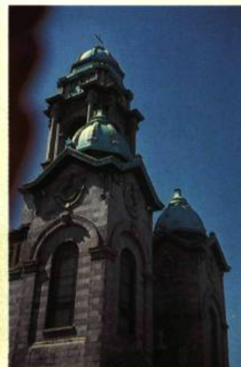
4. Les belles proportions de l'église Saint-Henri actuelle, rue du Couvent.