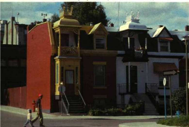
2. Au balcon: l'imagination victorienne à l'œuvre.