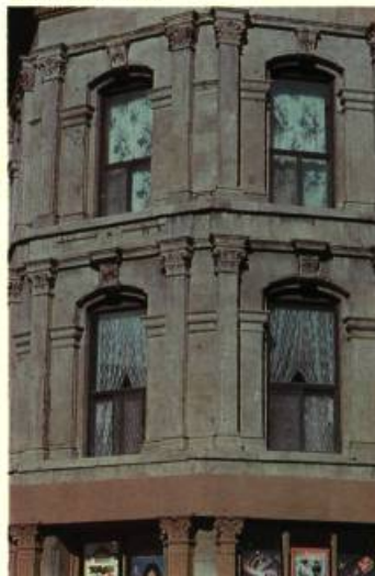
5. Exemple de l'utilisation d'un répertoire formel classique: ce bâtiment de la rue Saint-Jacques.