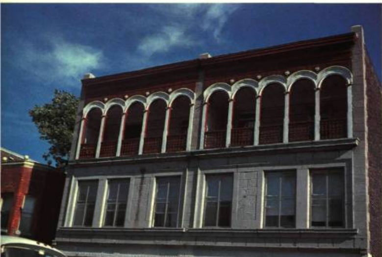
1. D'étonnantes surprises comme en réserve Saint-Henri: cette loggia située à l'étage supérieur d'une maison, rue Saint-Jacques.