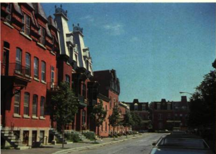
9. Exemple remarquable d'architecture urbaine populaire, rue Agnès, au cœur du quartier.