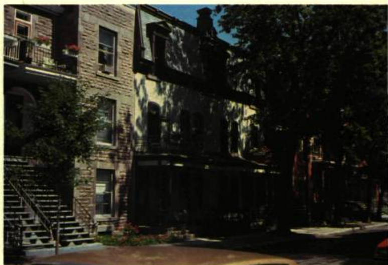
12. Dans toute l'intégrité de sa simplicité, une remarquable maison au toit faussement mansardé, avenue Laporte.