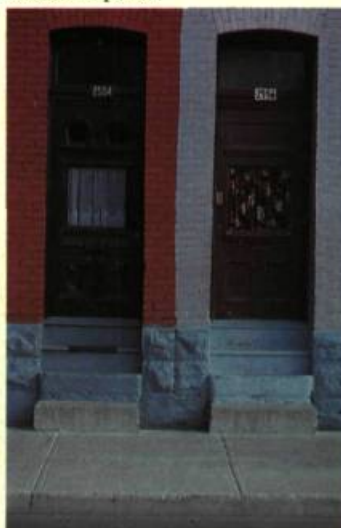
13. La couleur prenant la relève du bois sculpté des portes.