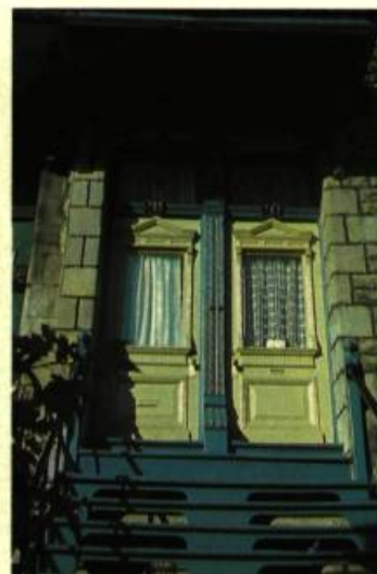
14. L'ornement architectural se résume parfois au décor étudié d'une porte sculptée.