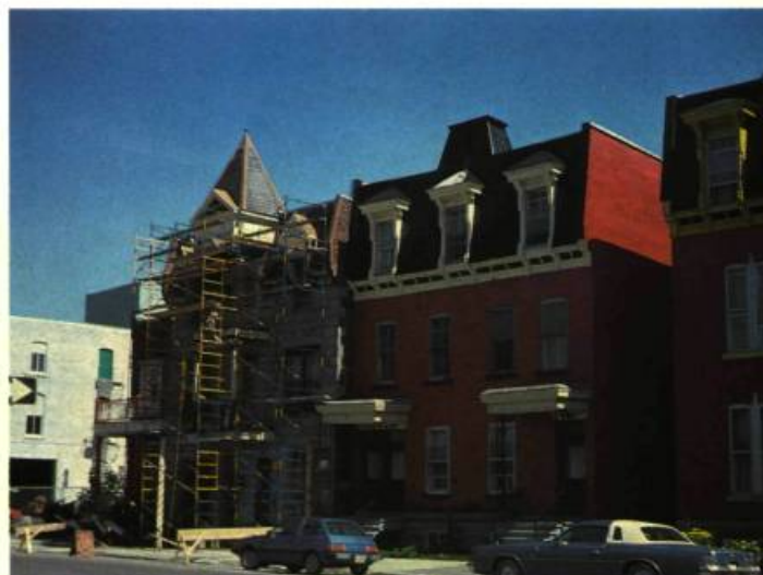
7. Vues de la rue Agnès, des maisons où l'on retrouve l'influence du style second Empire.