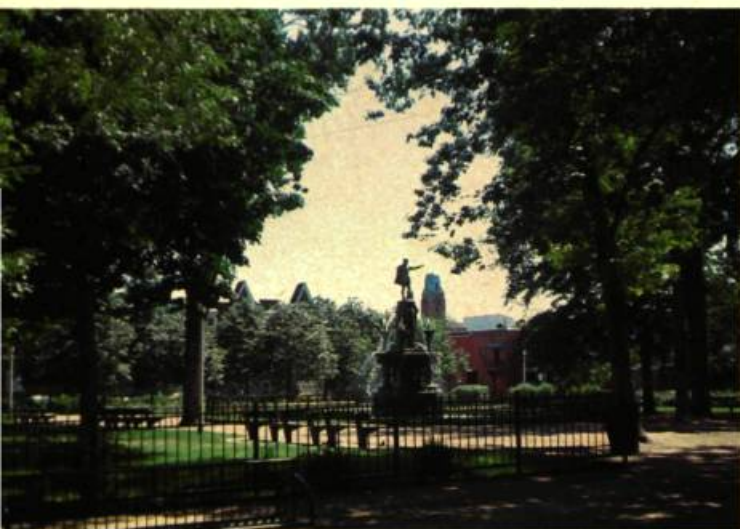
8. Vue d'ensemble du square Saint-Henri. Autour de ce parc, s'étale un des îlots du quartier les plus riches en bâtiments d'intérêt patrimonial.