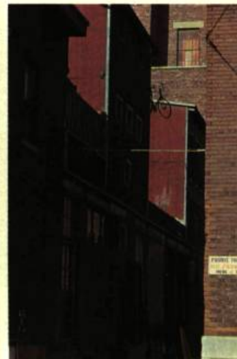
6. Un des nombreux aspects de Saint-Henri: l'allure cubiste de certains arrières de maison.