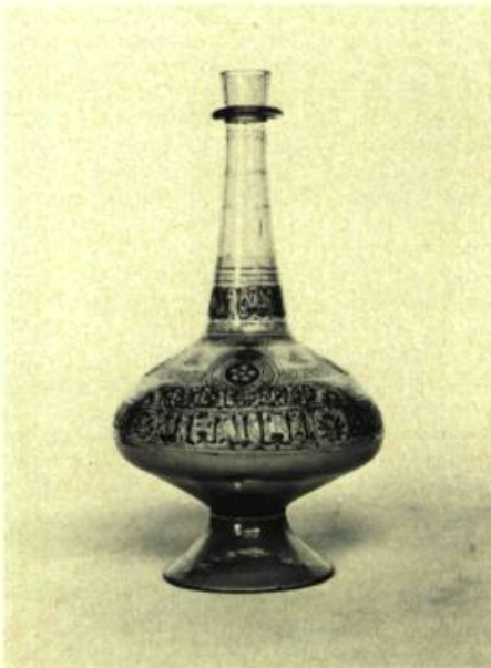
Art des Mamelouks. Bouteille, verre émaillé.

5200, avenue Woodward. Du 1er avril au 2 mai: 45e Exposition d'étudiants de Detroit; Jusqu'au 16 mai: L'Argenterie dans la vie américaine; Jusqu'au 6 juin: Portraits — Gravures, dessins et photographies; Du 24 avril au 20 juin: Renaissance de l'Islam — L'Art des Mamelouks.