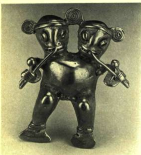
Pendentif à deux têtes. Art précolombien du Costa Rica