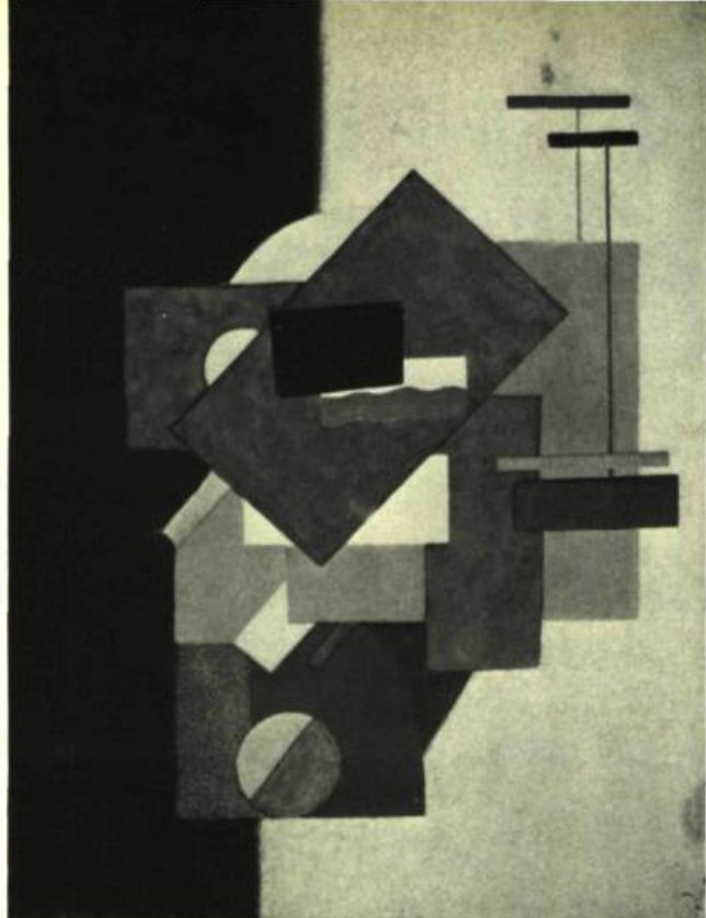
1. Yvan V. KLIUN Sans Titre, v. 1919-1921. Gouache sur papier; 38 cm x 29,3.