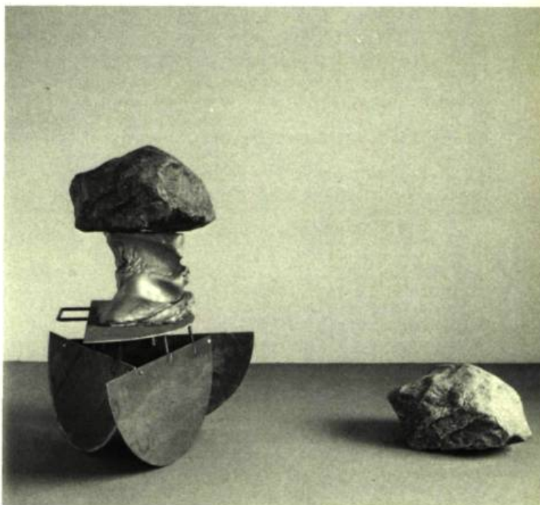
1. Giuseppe PENONE En état de rivière , 1981. Deux pierres, bronze et fer.