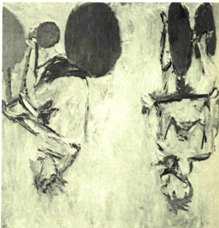
2. Georg BASELITZ, Filles d'Olmo II , 1981. Huile sur toile; 250 cm x 250. N.D.L.R. – L'artiste présente ses personnages tête-bêche.