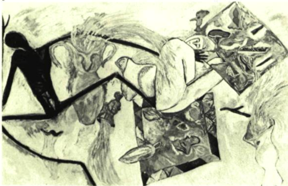
3. Elvira BACH Maillots de bain , 1981. Détrempe sur toile; 190 cm x 230.