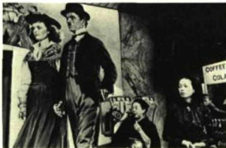
Sam TATA Théâtre, Tokyo, 1973. Impression noir et blanc; 16 cm x 25,4.

Rappelons que l'un des artistes, Sam Tata, a reçu, au printemps dernier, un doctorat honoraire en droit de l'Université Concordia.