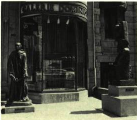
A gauche, Le Bourgeois de Calais , Jean d'Aire, de RODIN et, à droite, Upright Motive No. 5 , d'Henry MOORE.