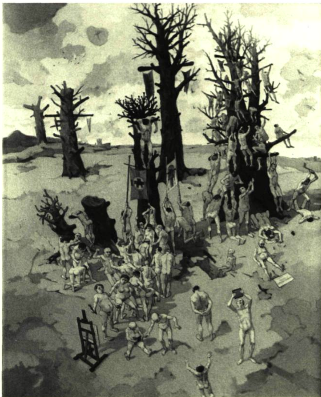
8. Gérard TROTTIER Les Arbres de Pâques , 1981. Acrylique sur toile; 152 cm 4 x 121,9.