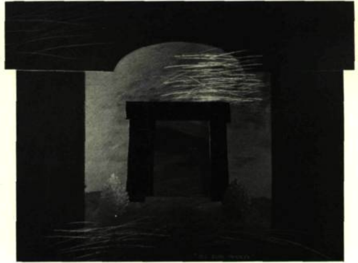
3. Des jours menacés 1981. Acrylique sur masonite; 61 cm x 81,30.

Sur ce thème dont le choix est affectif, un jeu. Rien que des images. Fragmenter, pluraliser, pulvériser la mémoire.