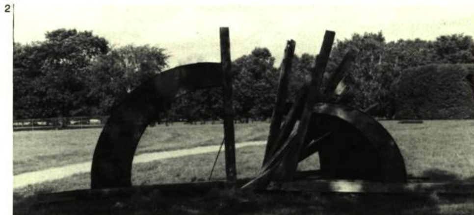
1. Tatiana DEMIDOFF-SÉGUIN