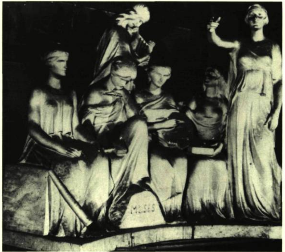
7. Alfred LALIBERTÉ Les Muses.

des 18 e et 19 e siècles (Baillairgé, Levasseur, Beaucourt, Dulongpré); l'apport du néo-classicisme français et italien (Plamondon, Hamel, Bourassa) ainsi que de l'académisme (Huot, Saint-Charles, Franchère, Larose, Leduc, Hébert); les représentants de l'École de Barbizon (Brymner, Walker), de l'impressionnisme (Cullen, Suzor-Coté, Pilot); les modernistes (Morrice, Jackson, Lismer, Lyman, Holgate, les Hébert, Fortin, Laliberté); les indépendants (Surrey, Gadbois, Roberts, Pellan); le surréalisme et l'automatisme (Pellan, Dallaire, Bellefleur, Gauvreau, Riopelle, Ferron); les plasticiens (Molinari, Tousignant, Hurtubise, Leduc); l'abstraction lyrique (McEwen); l'influence américaine des années 1970 (Barbeau, Comtois, Jean).