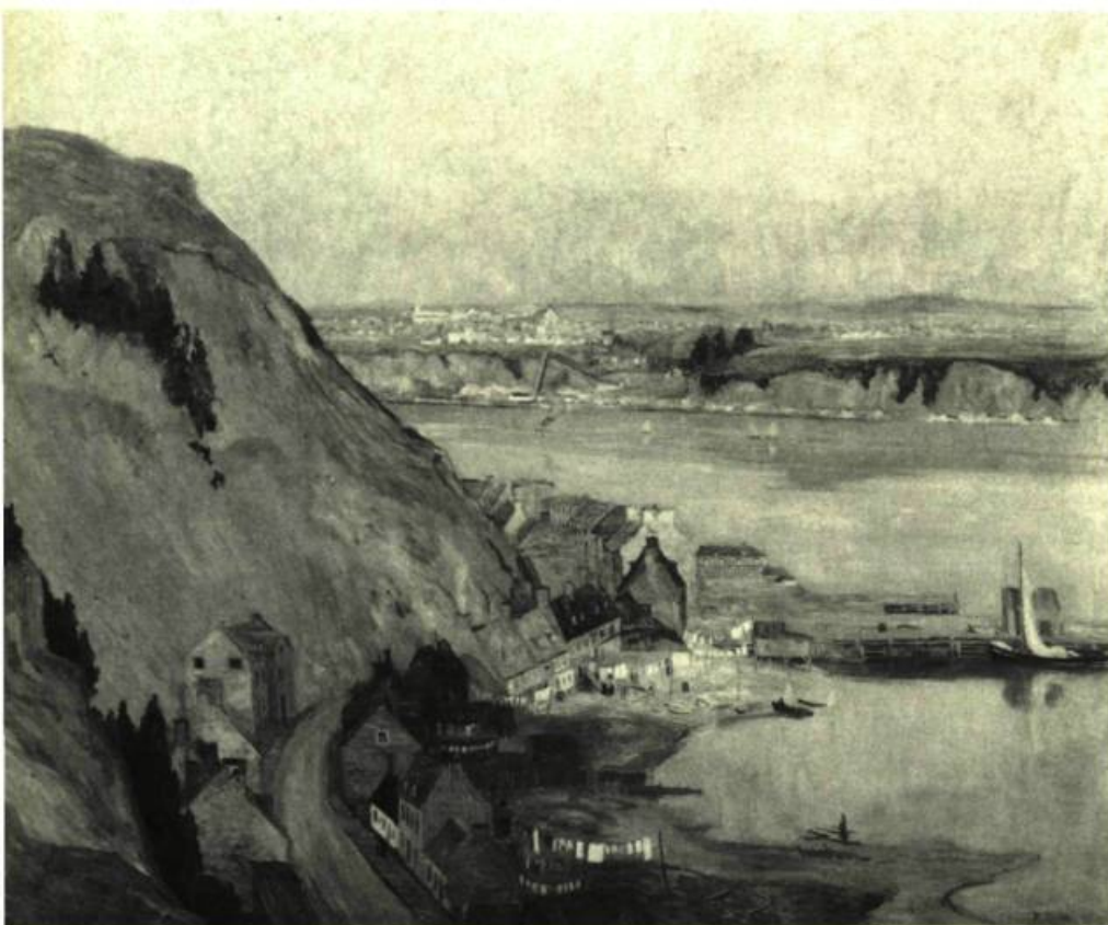
6. Maurice CULLEN L'Anse des mères, 1904. Huile sur toile; 144 cm x 176,2.