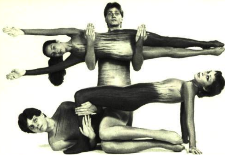
4. Les Ballets Jazz de Montréal La Machine , de Daryl Gray, 1981.