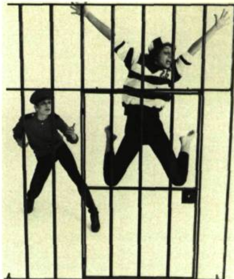
5. Les Ballets Jazz de Montréal Jailhouse Jam , de Daryl Gray, 1983.

Non moins important, le dernier spectacle des BJDM, qui soulignait leur dixième anniversaire, faisait sa marque sur la scène montréalaise. Collage aussi diversifié qui lui enlevait son unité d'ensemble. LBJDM présentaient au public deux créations de Judith Marcuse dont Hors-d'œuvre (plutôt un exercice de style qu'une chorégraphie) et On Castle Rock , œuvre poétique se limitant à la manière plutôt que d'évoluer vers l'évocation.