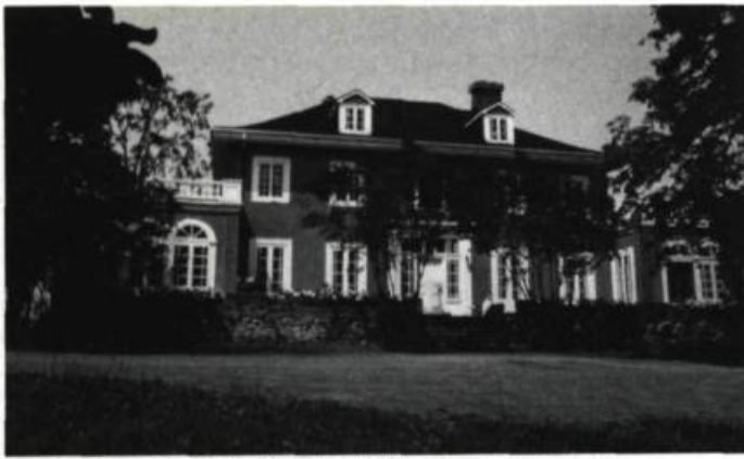
9. Maison Jean-Roch Rolland, à Saint-Mathias, v. 1830.