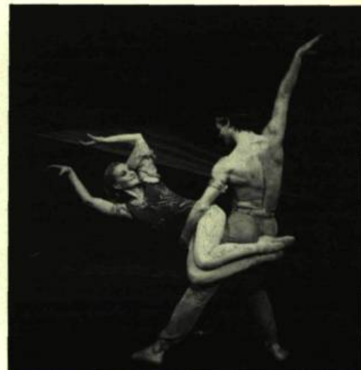
3. Les Grands Ballets Canadiens Chant du roseau , de Brian Macdonald, 1983.