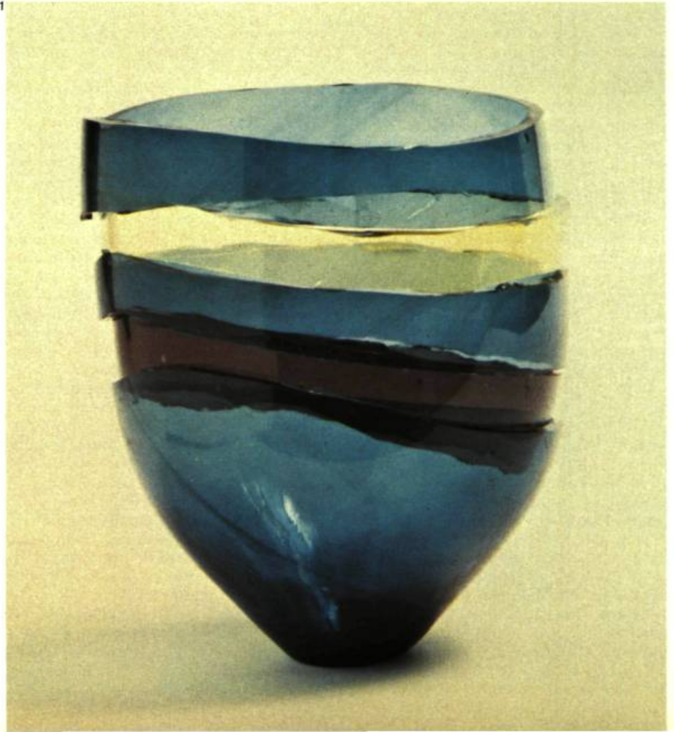
1. François HOUDÉ Sans titre.

Or voilà qu'un maître verrier, s'interrogeant sur la notion de perfection qu'on associe ordinairement à l'art appliqué et