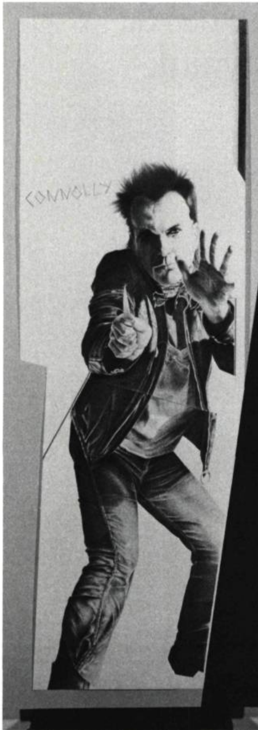
1. Reynald CONNOLLY Claude Poule Dieu, 1983. Graphite sur papier; 181 cm x 63,50.