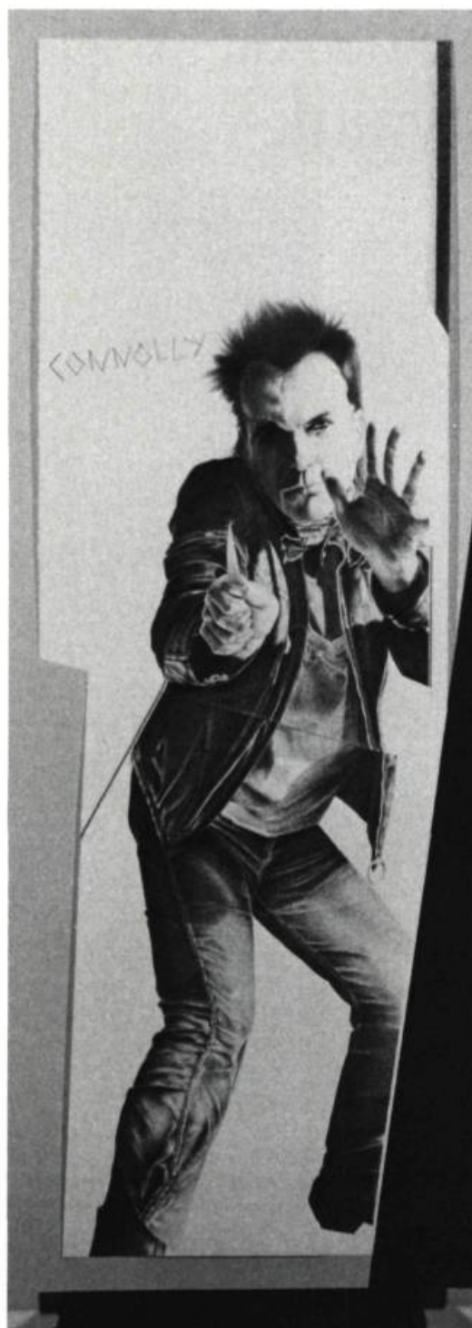
1. Reynald CONNOLLY Claude Poule Dieu, 1983. Graphite sur papier; 181 cm x 63,50.