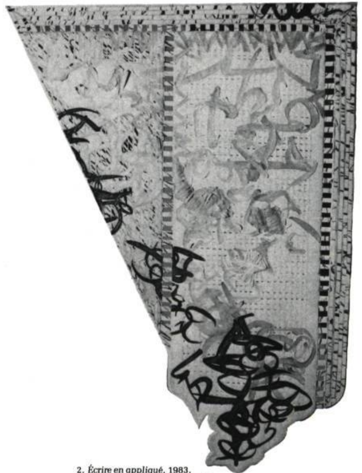
2.  crire en appliqu , 1983. Technique mixte; 109 cm x 80.

C'est ce qui g ne certains. Les acquis et les r alit s d'une culture de femmes sont montr s ici; mais en tant que femme artiste il y a moins d'honneur   montrer qu'on sait faire des courtpointes et plus de danger   ce qu'un losange ou un triangle puisse sugg rer la forme du sexe f minin. Si la r f rence est ici g nante pour certains, c'est non par sa clart  d' vocation mais bien   cause de ce qui est  voqu : les femmes et les travaux dits f minins. Il est vrai qu'il est temps de sortir de la nostalgie des couvertures faites   la main et du sexe des femmes: les premi res ont  t  remplac es, il y a